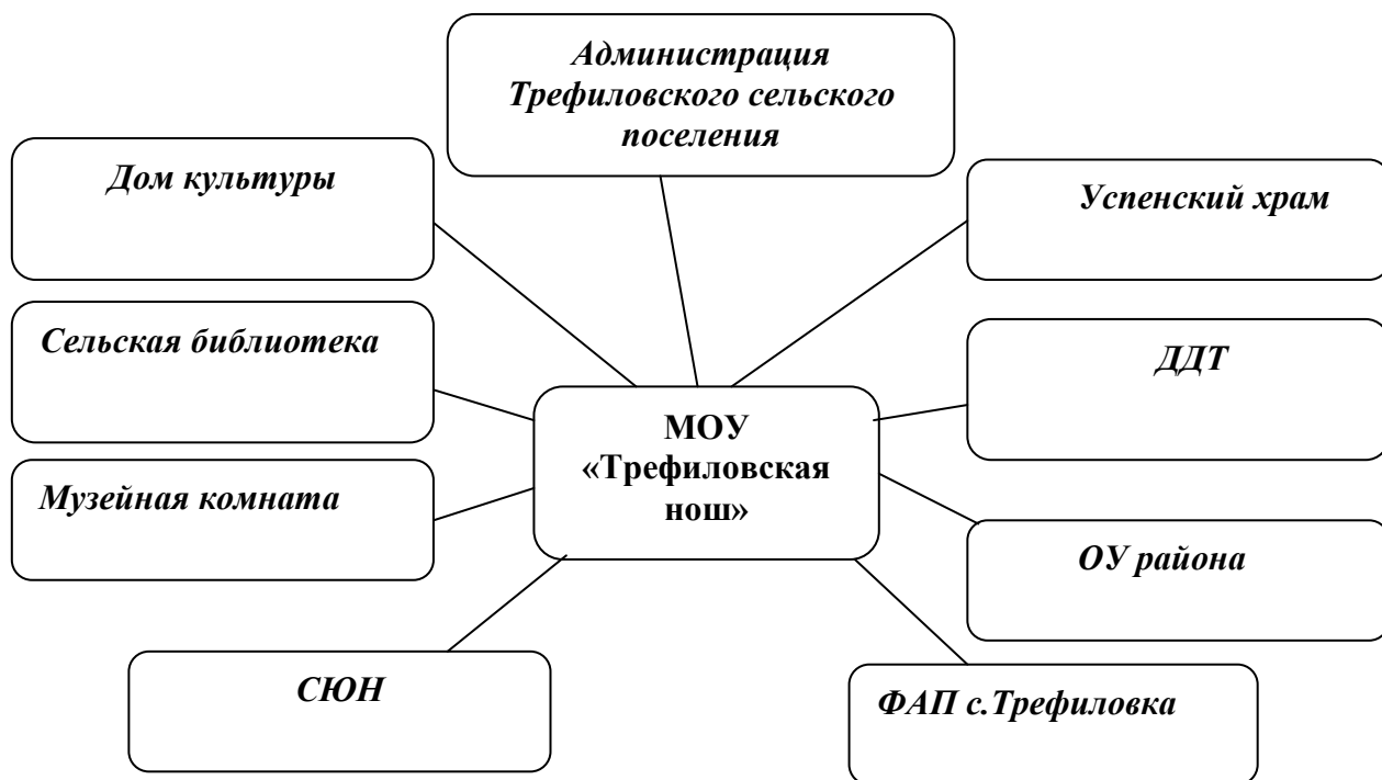
Схема взаимодействия с социумом

Среди родителей обучающихся и воспитанников дошкольных групп преобладают служащие, работники бюджетной и торговой сферы. По материальному положению семьи детей распределяются следующим образом: семьи с низким уровнем доходов (уровень доходов в семье на человека ниже прожиточного минимума) – 32%; со средним – 48%; с высоким – 20 %.